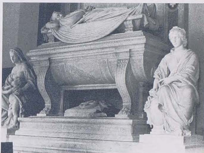
Mausoleo de Josep Xifré, en la capilla. Obra del escultor francés Charles Alphonse Gumery.

Los jardines que circundan el edificio han sufrido numerosas modificaciones y expolios en el transcurso del tiempo, desde huertas para el mantenimiento del hospital, pasando por zonas ajardinadas con naranjos y fuentes hasta el actual estado de notable deterioro, excepto en la zona más próxima al edificio.