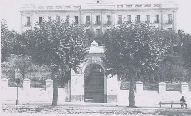
Conjunto visto desde la Rambla.

Quan aquest número es trobava en premsa ens arribà la resolució de la «Dirección General del Patrimonio Artístico, Archivos y Museos» amb data 15 de juny del 78 i publicada al B.O.E. 5-8-78, que diu: «incoar expediente declaración monumento histórico-artístico interés Nacional Hospital Xifré de Arenys de Mar.»